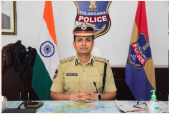
పార్టీలు నిరంతరం పెట్రోలింగ్ పోలీస్ బృందాలు పెట్రోలింగ్ నిర్వహిస్తారని పోలీస్ కమిషనర్ వెల్లడించారు.

మున్సిపల్ ఎన్నికలను ప్రశాంతంగా నిర్వహించేందుకు పకడ్బందీ ఎర్పాట్లు చేసినట్లుగా వరంగల్ పోలీస్ కమిషనర్ తెలిపారు. బుధవారం వరంగల్ పోలీస్ కమిషనరేట్ పరిధిలోని జనగామ, ఘనస్పూర్, వర్ధన్నపేట, వరకాల, నర్సంపేట మున్సిపల్ ఎన్నికల బందోబస్తు నిర్వహణ కోసం 1100 మైగా పోలీసులను వినియోగించడం జరుగుతుందని ఇందులో ముగ్గురు డిసిపిలతో పాటు ఐదుగురు అదనపు డిసిపిలు 4మంది, ఏసిపిలు 11మంది, ఇన్స్పెక్టర్లు 125 మంది, ఎస్.ఐలు 113 మంది, ఏ.ఎస్.ఐ/హెడ్ కానిస్టేబుళ్ళు, కానిస్టేబుళ్ళు 515, హోంగార్డ్స్ 226 మంది వీరితో పాటు డిప్యూటీ గార్డ్స్, బాంబ్ డిస్పోజిషన్ విభాగాలకు చెందిన సుమారు 168 సిబ్బంది విధులు నిర్వహిస్తున్నారు. ఎన్నిక వేళ అదనపు డిసిపి స్థాయి వర్యవేక్షణలో స్పెషల్ డ్రెస్సింగ్ ఫోర్స్ నియమించడం జరిగిందని, ఎన్నికల జరిగే ప్రతి మున్సిపల్ పరిధిలో ఒక ఏసిపి స్థాయి అధికారిని ఇంచార్జ్గా ఉంచారు. రూటు మొబైల్స్ టీంలు, షాడో పార్టీలు, ప్రతి పోలింగ్ కేంద్రంలో ఒక ఎస్.ఐ/ఎస్.ఐతో పాటు హెడ్ కానిస్టేబుళ్ళు, కానిస్టేబుళ్ళు, హోంగార్డులు విధులు నిర్వహిస్తారని, మొత్తం